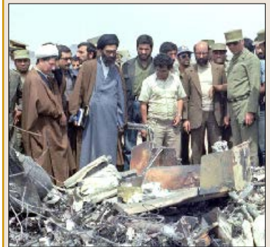
۵ اردیبهشت سالروز شکست حمله نظامی آمریکا به ایران در طبرس گرامی باد

۳- سعی کنید که در این روزهای باقی‌مانده تا کنکور، اوقات خود را در کنار خانواده سپری کنید و در این کانون گرم، آرامش لازم را به منظور حضور سودمند و مؤثر در جلسه آزمون سراسری، برای خود فراهم نمایید.